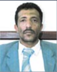
■ بكيل خيران