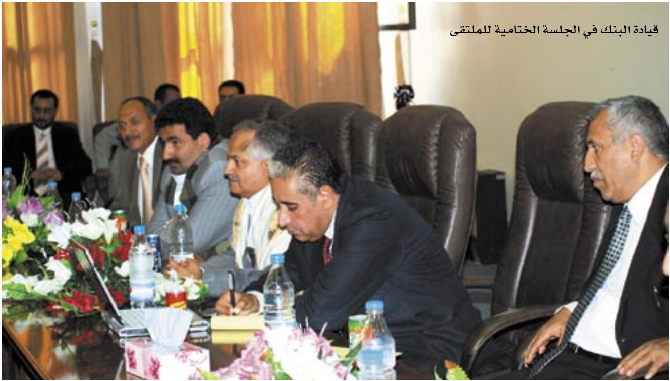
قيادة البنك في الجلسة الختامية للملتقى