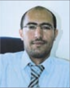
■ فيصل الأسد -الملكة اروى